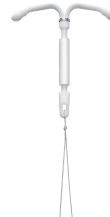
Tikras Fleree dydis /Fleree reālā izmēra attēls/ Fleree tegelik suurus

Intrauteriinne ravivahend sisaldab 13,5 mg levonorgestreeli. Abiained: polūdimetūilsiloksaanelastomeer, koloidne veevaba rānidioksiid, polūietūleen, baariumsulfaata, must raudoksiid (E172), hōbe. Paigaldamiseks teravishoiutōotaja poolt. Pakend sisaldab juhiseid. Hoida laste eest varjatud ja kättesaamatus kohas. Ravimpreparaat on steriilne. Mitte kasutada, kui blisterpakend on kahjustatud vōi avatud. Patsiendile tuleb kaasa anda pakendi infoleht ja patsiendikaart. Patsient peab enne ravimi kasutamist lugema pakendi infolehte. Retseptiravim.